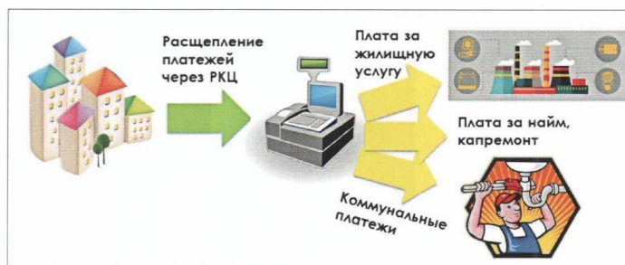
Рис. 3. Схема работы РКЦ

Концепция РКЦ как единого центра информатизации достаточно привлекательна для многих участников отрасли. В течение 2015 года к расчетам через РКЦ присоединились администрация Норильска в части организации расчетов по договорам социального и коммерческого найма, а также четыре УК. Таким образом, в настоящее время охвачено 90% рынка ЖКУ города. Результат очевиден: процент оплаты за коммунальные услуги управляющими организациями в адрес РСО за 2016 год достиг 99%, тогда как в 2013-м он составлял 84%.