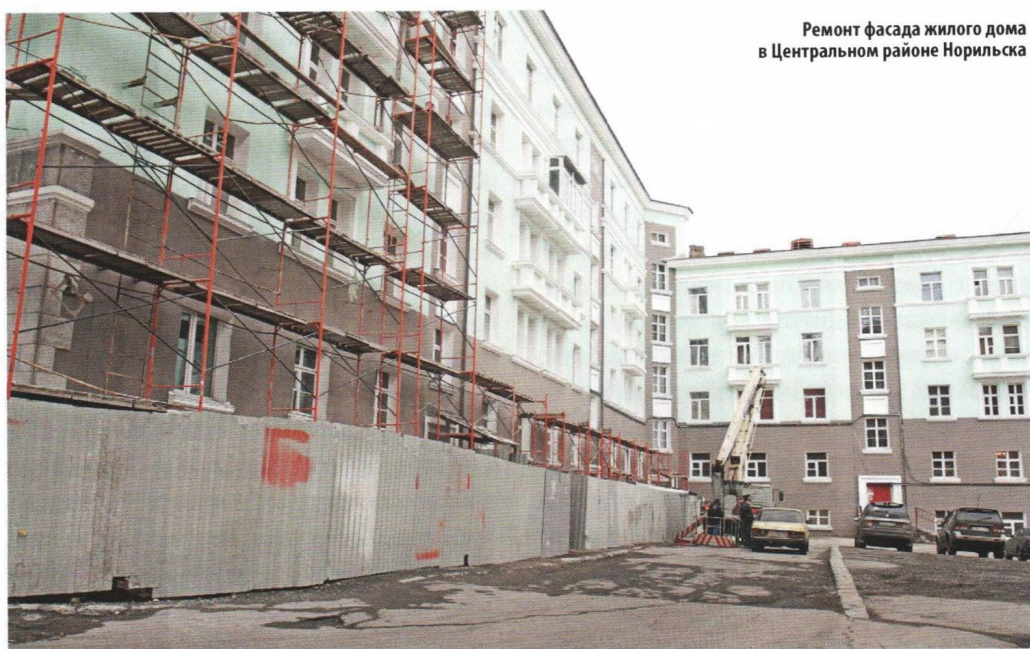
Ремонт фасада жилого дома в Центральном районе Норильска

В целом можно сказать, что все действия по реформированию отрасли ЖКХ в Норильске направлены на то, чтобы сделать более комфортной жизнедеятельность и защитить законные права и интересы жителей Крайнего Севера, живущих в тяжелых природно-климатических условиях. На примере Норильска можно отметить, что такой опыт эффективного взаимодействия органов местного самоуправления, УК, РСО и общественных организаций, а также других представителей гражданского общества может быть использован во многих российских городах. Это подтвердили и эксперты форума ЖКХ, предложившие применить алгоритм создания РКЦ в других моногородах Арктической зоны России.