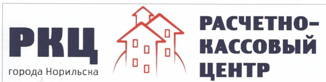
Рис. 2. Фирменный стиль РКЦ Норильска

услуг. Специалистами РКЦ был рассчитан тариф, который покрывал также единовременные расходы на запуск предприятия. Таким образом, муниципалитет не вложил ни рубля бюджетных средств.