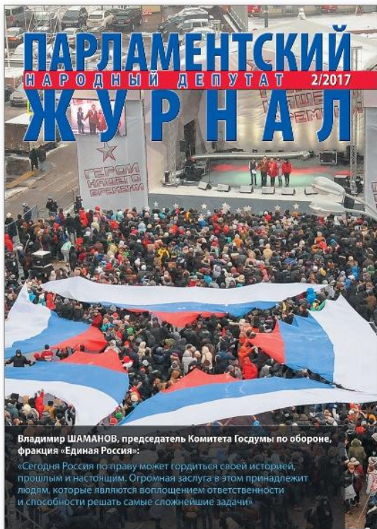
Владимир ШАМАНОВ , председатель Комитета Госдумы по обороне, фракция «Единая Россия»:

«Сегодня Россия по праву может гордиться своей историей, прошлым и настоящим. Огромная заслуга в этом принадлежит людям, которые являются воплощением ответственности и способности решать самые сложнейшие задачи».